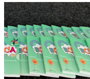
DISTRUBUIÇÃO DO ECA

Juntos, seguimos fortalecendo as instituições e construindo um futuro melhor para nossas crianças e adolescentes!