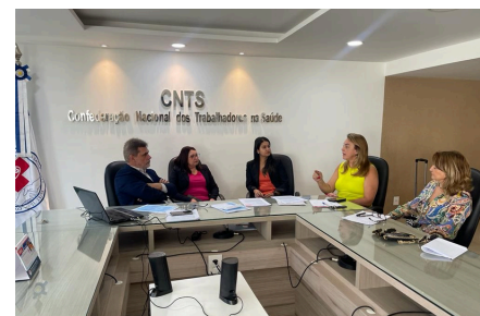
REUNIÃO ENTRE SINIBREF E CNTS PARA CELEBRAÇÃO DA PRIMEIRA CCT

O Piso Nacional da Enfermagem tornou-se uma pauta importante para muitas Instituições, especialmente na área da saúde. O SINIBREF tem atuado ativamente nesse debate, promovendo reuniões, oferecendo apoio jurídico e viabilizando negociações coletivas para garantir a conformidade das Instituições com a nova legislação. Um destaque foi a assinatura da primeira Convenção Coletiva de Trabalho de abrangência nacional com a CNTS, que trouxe avanços para enfermeiros e Instituições Benéficas, equilibrando as demandas dos trabalhadores e as necessidades das Instituições.