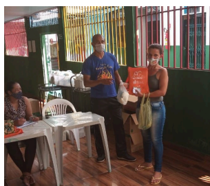
ENTREGA DOS KITS DE LIVROS