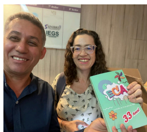
DISTRIBUIÇÃO DO ECA