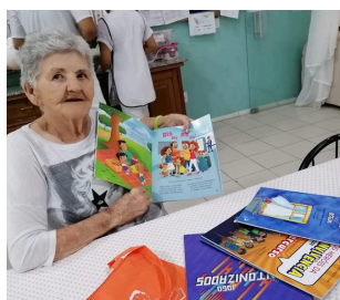
KITS DE LIVROS

como captação de recursos, gestão e elaboração de projetos, fortalecendo assim a atuação das Instituições. Além disso, com o Programa Direito e Cidadania (PDEC), beneficiamos diversas Instituições ao abordar temas importantes para a educação e a cidadania. Como parte desse trabalho, já distribuimos mais de 20.000 exemplares do Estatuto da Criança e do Adolescente (ECA), tanto em formato físico quanto digital, que está disponível em nosso site.