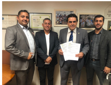
DIRETORIA DO SINIBREF E O DEPUTADO DOMINGOS SÁVIO